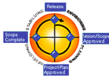
Abb. MSF Prozessmodell

MSF-Grundsätze eines erfolgreichen Prozesses: